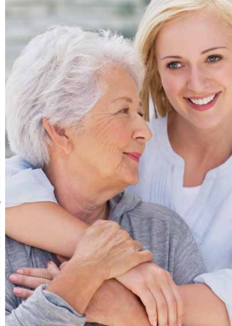
E.R. : La Passerinette, Rue des Deux Tilleuls, 69, 4630 Soumagne. Photos non contractuelles.